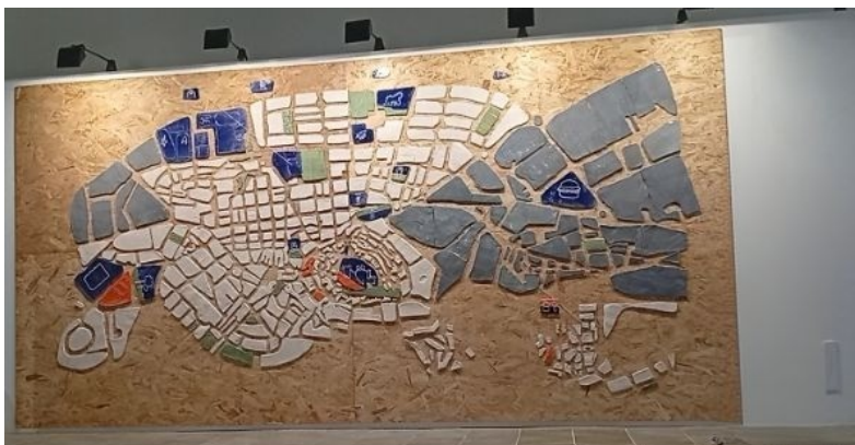
Peces de la instal·lació d'altres edicions.