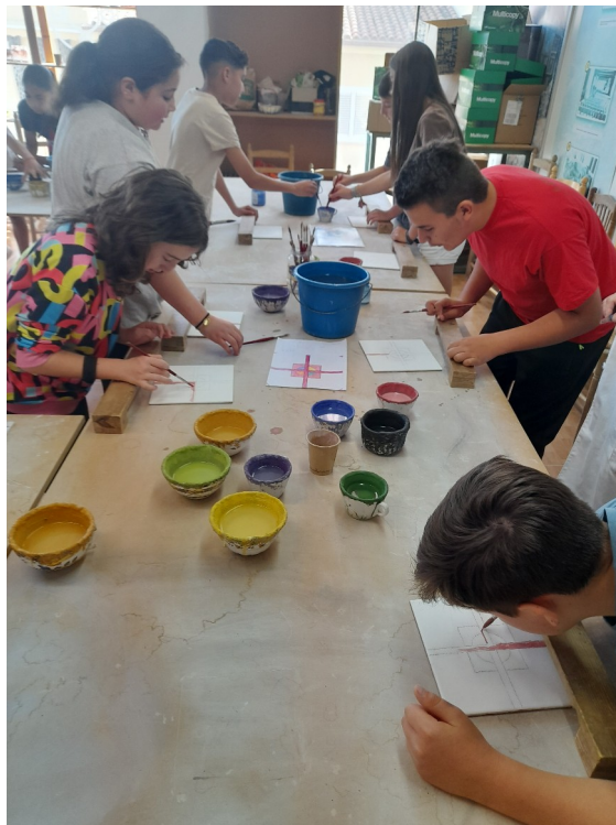
Imatges del procés de creació i muntatge de peces de l'edició de 2025.

A partir de les obres resultants d'estos projectes, el taller familiar del dissabte 26 de maig proposarà als participants crear les seues pròpies obres artístiques de col·laboració entre tots els membres de la família, experimentant diferents tècniques de manipulació i decoració ceràmica. Alhora, gaudiran de les creacions exposades al Museu que ens serviran d'inspiració en una visita interpretativa i adaptada.