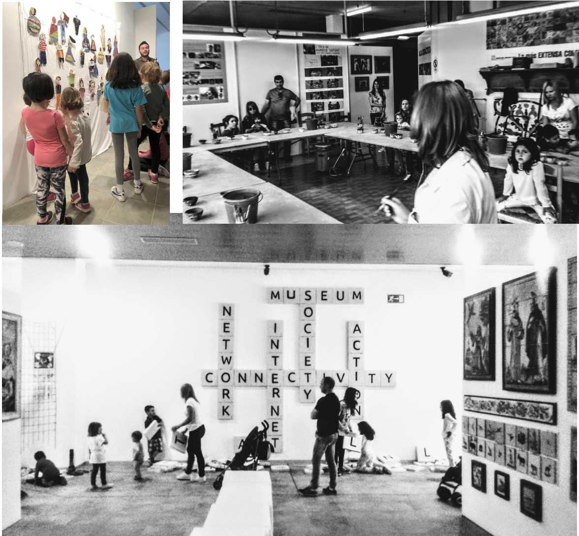
Imatges de tallers familiars d'altres edicions sobre la mostra d'obra artística de l'IES Serra d'Espadà amb motiu del Dia Internacional dels Museus.

A més, l'activitat s'emmarca en la tendència que l'Ajuntament d'Onda ha emprés per tal de fomentar societats més igualitàries, més justes, inclusives i sostenibles aproximant-nos a la consecució dels objectius marcats per l'Agenda 2030 de Desenvolupament Sostenible de l'ONU (Assemblea General de les Nacions Unides) per a aconseguir un objectiu social comú: transformar el nostre món a través del desenvolupament global i humà a partir dels Objectius de Desenvolupament Sostenible, per a esta finalitat. Concretament, ens endinsem en esta activitat en l'objectiu número 4 (Educació de qualitat)