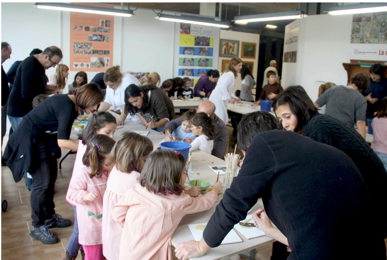
Imatge d'arxiu. Museu del Taulell «Manolo Safont»

Per al primer trimestre de 2025, i continuant amb la programació de l'últim trimestre de 2024, s'han programat algunes sessions entre gener i març en què els participants podran experimentar i conèixer diferents tècniques d'elaboració i decoració ceràmiques mitjançant el treball col·laboratiu entre tots els membres de la família i a partir de continguts relacionats amb les col·leccions del Museu i les seves exposicions temporals. Cada taller tindrà una temàtica diferent i seran anunciats degudament.