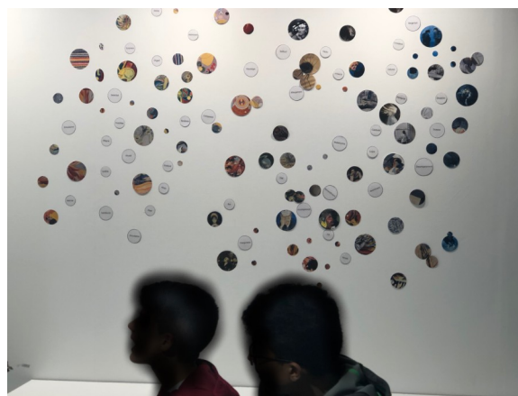
Peces de la instal·lació d'altres edicions.