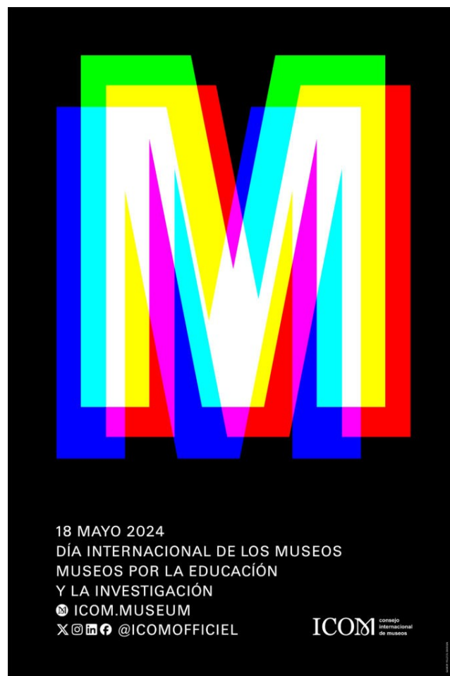
Cartell de l'ICOM per commemorar el Dia Internacional dels Museus amb el lema escollit per a enguany.