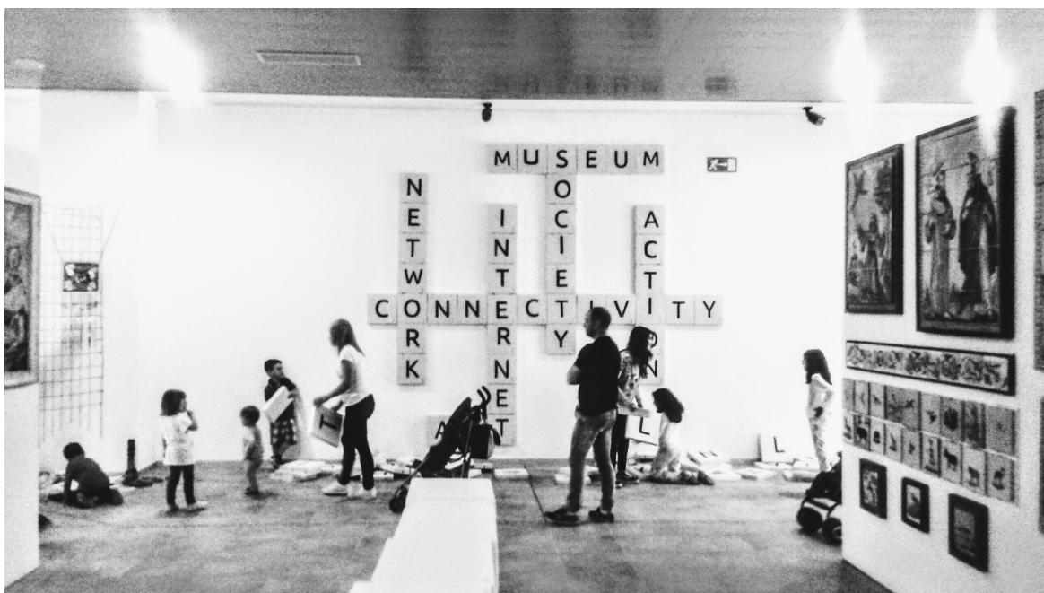
Imatges de tallers familiars d'altres edicions sobre la mostra d'obra artística de l'alumnat de l'IES Serra d'Espadà amb motiu del Dia Internacional dels Museus.

A més, l'activitat s'emmarca en la tendència que l'Ajuntament d'Onda ha emprés per tal de fomentar societats més igualitàries, més justes, inclusives i sostenibles aproximant-nos a la consecució dels objectius marcats per l'Agenda 2030 de Desenvolupament Sostenible de la ONU (Assemblea General de les Nacions Unides) per a aconseguir un objectiu social comú: transformar el nostre món a través del desenvolupament global i humà a partir dels Objectius de Desenvolupament Sostenible, per a aquesta finalitat. Concretament ens endinsem en aquesta activitat en l'objectiu número 4 (Educació de qualitat)