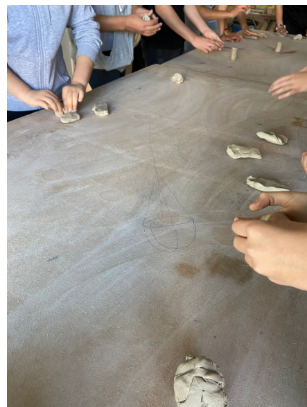
Imatges del procés de creació de peces de la edició de 2023.

A partir de les obres resultants d'aquests projectes, el taller familiar del dissabte 18 de maig proposarà als participants crear les seves pròpies obres artístiques de col·laboració entre tots els membres de la família, experimentant diferents tècniques de manipulació i decoració ceràmica. Al temps que gaudiran de les creacions exposades al Museu que ens serviran d'inspiració en una visita interpretativa.