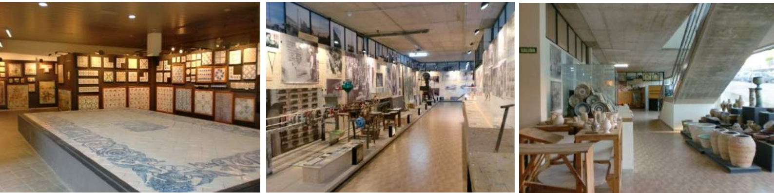
Interiors del Museu del Taulell.

Però no sempre s'han fet taulells a Onda. Abans d'aparéixer les fàbriques industrials, a la localitat ja existien tallers d'artesans que produïen tota mena de peces amb fang. Al Museu no podíem oblidar aquesta ceràmica tradicional, que no deixa de ser l'antecessora de la producció de taulells que hui tant ens caracteritza.