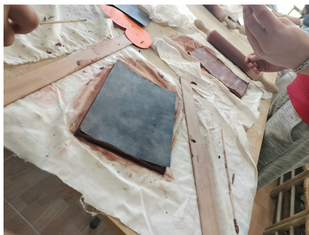
Detalls de l'elaboració de les peces ceràmiques de l'exposició elaborades per alumnat dels instituts participants.