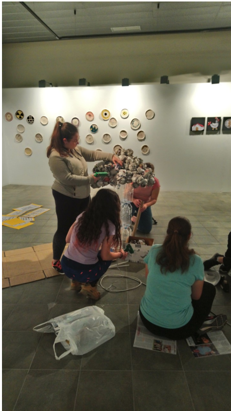
Alumnat de l'IES Serra d'Espadà muntant l'exposició de l'edició de 2019.