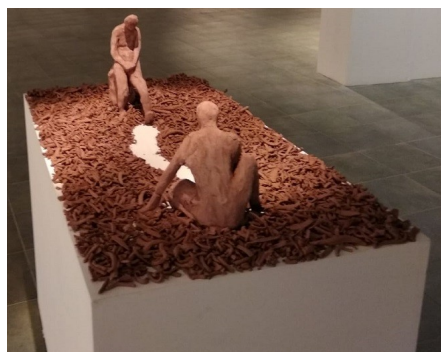
Peces de la instal·lació de l'edició de 2019.

El programa "Dissabtes de ceràmica", a part dels tallers programats pel Museu, també contempla la possibilitat que si diverses famílies aconsegueixen reunir un grup de més de 10 persones, puguin concertar amb el Museu un taller familiar per a aquest grup en concret. Per a més informació consultar amb el personal del Museu.