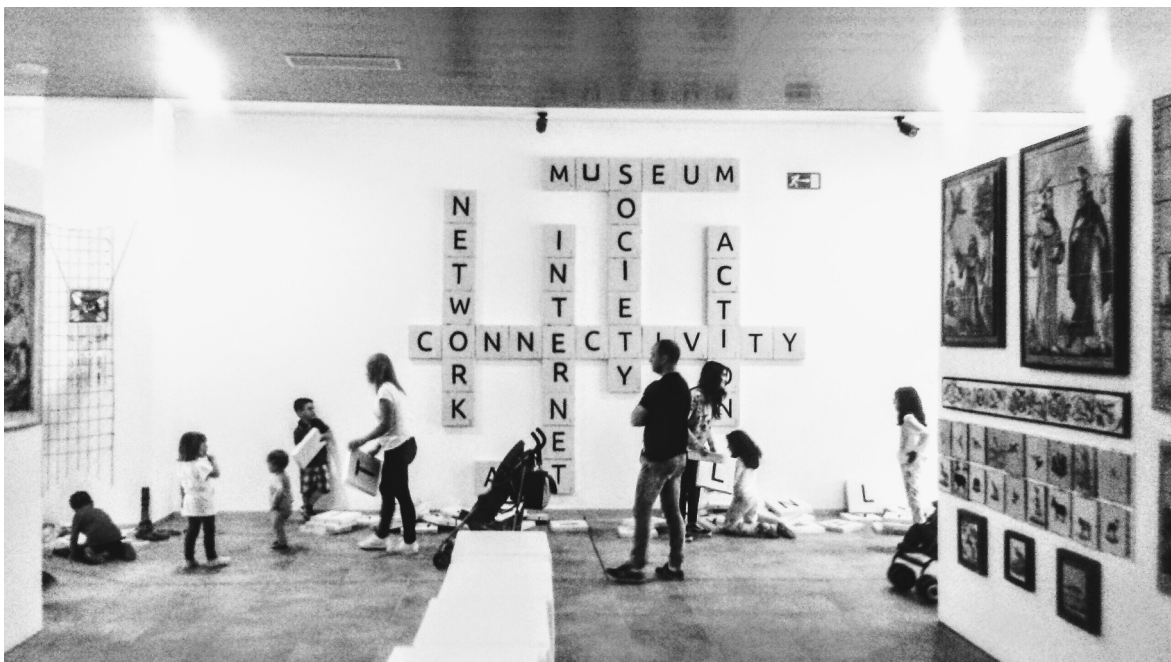
Imatges de tallers familiars d'altres edicions sobre la mostra d'obra artística de l'alumnat de l'IES Serra d'Espadà amb motiu del Dia Internacional dels Museus.

Les famílies que desitgin participar en la sessió del proper 20 de maig podran realitzar reserva telefònica trucant al Museu del Taulell (964 77 08 73) a partir del dimarts 9 de maig i fins al dia d'abans de la seva celebració o fins arribar al límit de 40 places; llavors s'obrirà llista d'espera. Les taxes per a poder realitzar l'activitat s'han establert en 3€ per participant, sent gratuït per a menors de 4 anys, persones amb discapacitat i empadronats a Onda.