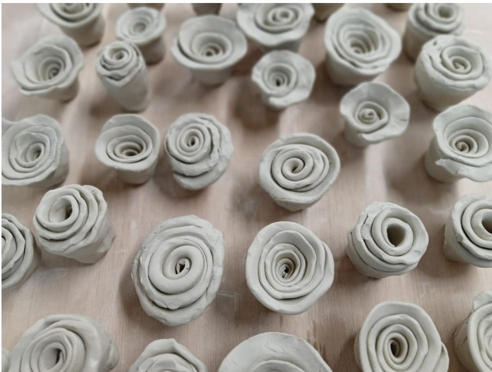
Procés d'elaboració de peces per alumnat de l'IES Serra d'Espadà.

En aquesta ocasió, estrenem nova proposta didàctica en la sessió programada per al dissabte 21 de maig , amb l'objectiu d'apropar a grans i menuts a distints processos i tècniques ceràmiques de decoració per a realitzar les nostres pròpies creacions artístiques. Per a inspirar-nos, prendrem com a punt de partida les peses que trobarem a la instal·lació temporal del Museu que ens mostra els treballs artístics realitzats per l'alumnat de l'IES Serra d'Espadà , de la Secció de l'IES Serra d'Espadà i el Centre el Molí d'Onda amb motiu del projecte coordinat des del Museu del Taulell per celebrar el Dia Internacional dels Museus .