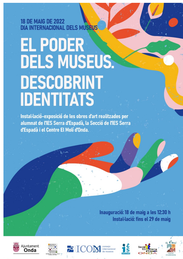
Cartell de l'ICOM per commemorar el Dia Internacional dels Museus 2022.