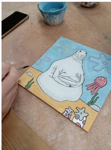
Alumnat de l'IES Serra d'Espadà i de la Secció realitzant obra per a l'exposició.

En aquest ocasió, al lema dels museus s'ha afegit el subtítol DESCOBRINT IDENTITATS , que ha servit per que l'alumnat participant reflexione sobre la diversitat cultural i social existent al món i com aquesta diversitat ens dibuixa un panorama de múltiples i variades identitats individuals i col·lectives que enriqueixen la convivència i el mestissatge de cultures i sabers que ens fa evolucionar, créixer i compartir entre individus i col·lectius.