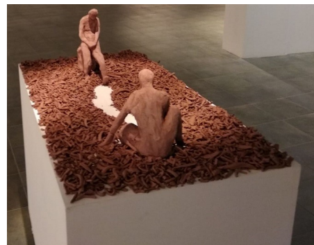
Peces de la instal·lació de l'edició de 2019.