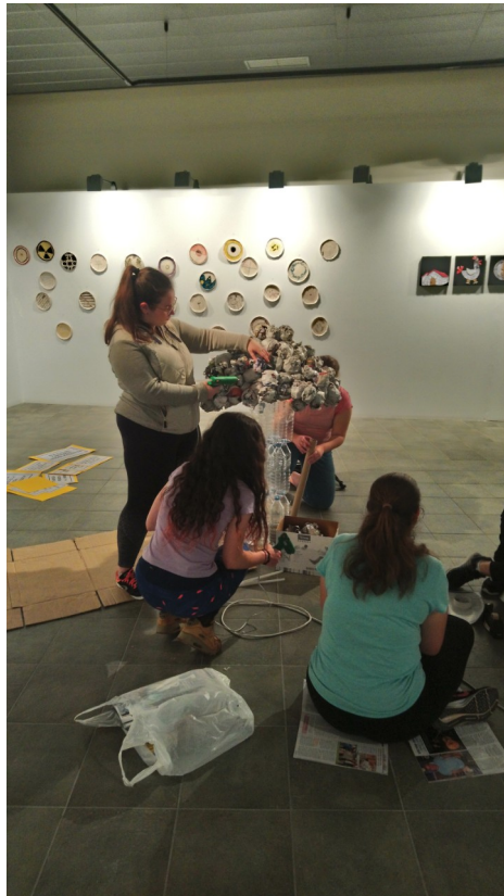
Alumnat de l'IES Serra d'Espadà muntant l'exposició de l'edició de 2019.

Aquesta programació contribueix a consolidar l'extensa oferta educativa del Museu.